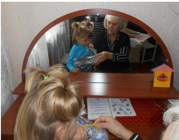
Дыхательная гимнастика « Вьюга »