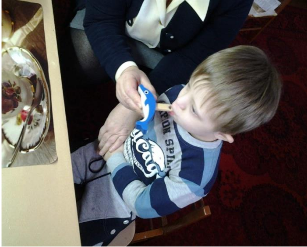
Дуем в свисток