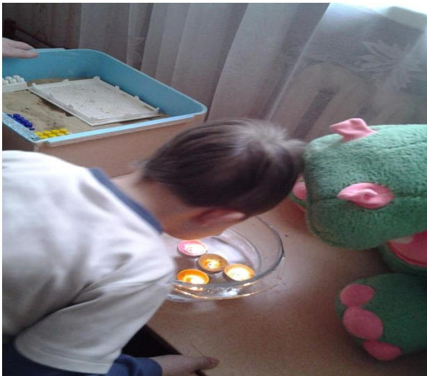
Задуваем плавающие в воде свечи